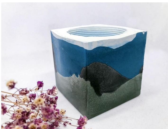
彩色四角貼模水泥盆