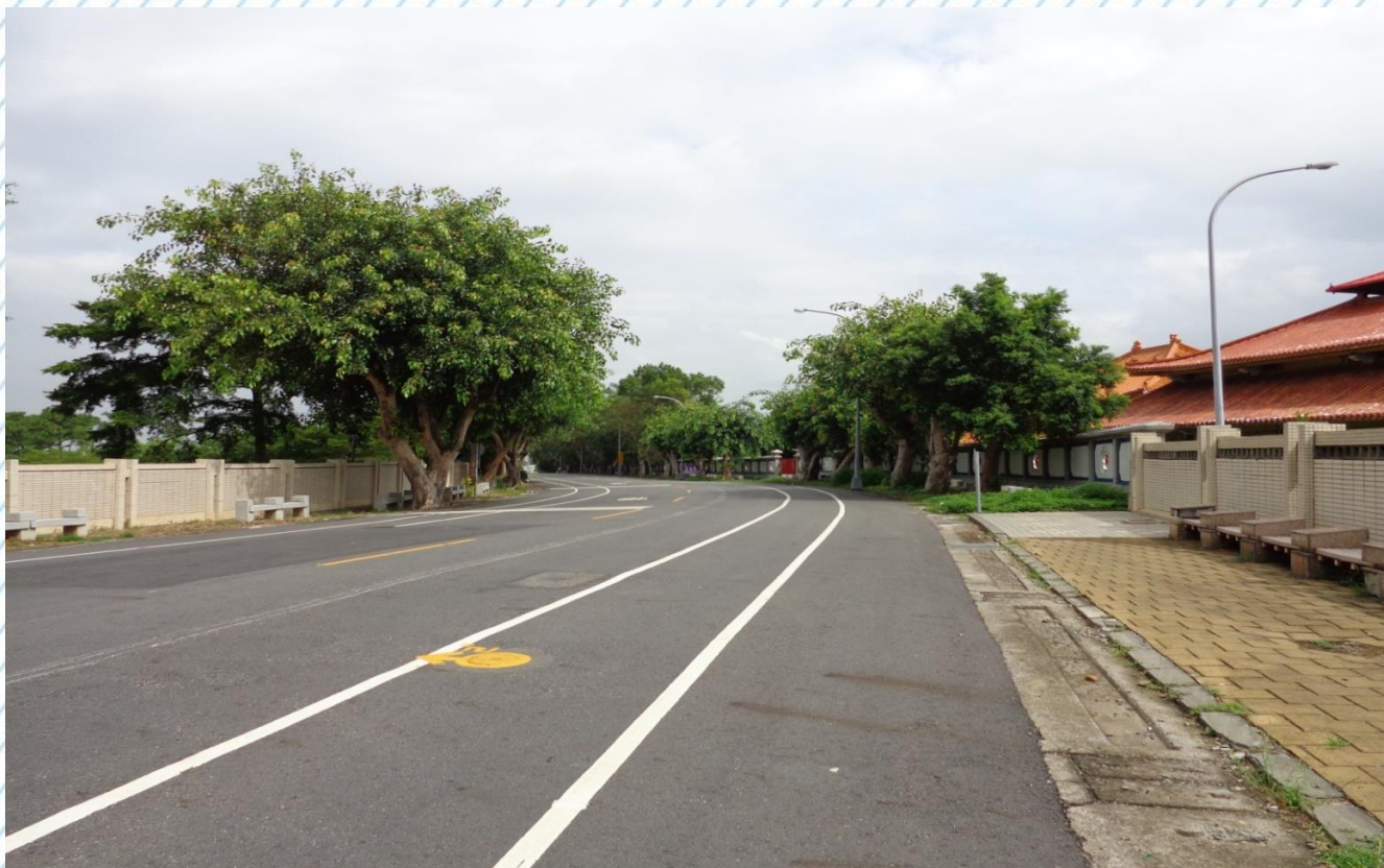
寶山路寶山校區旁下坡轉彎處(17)