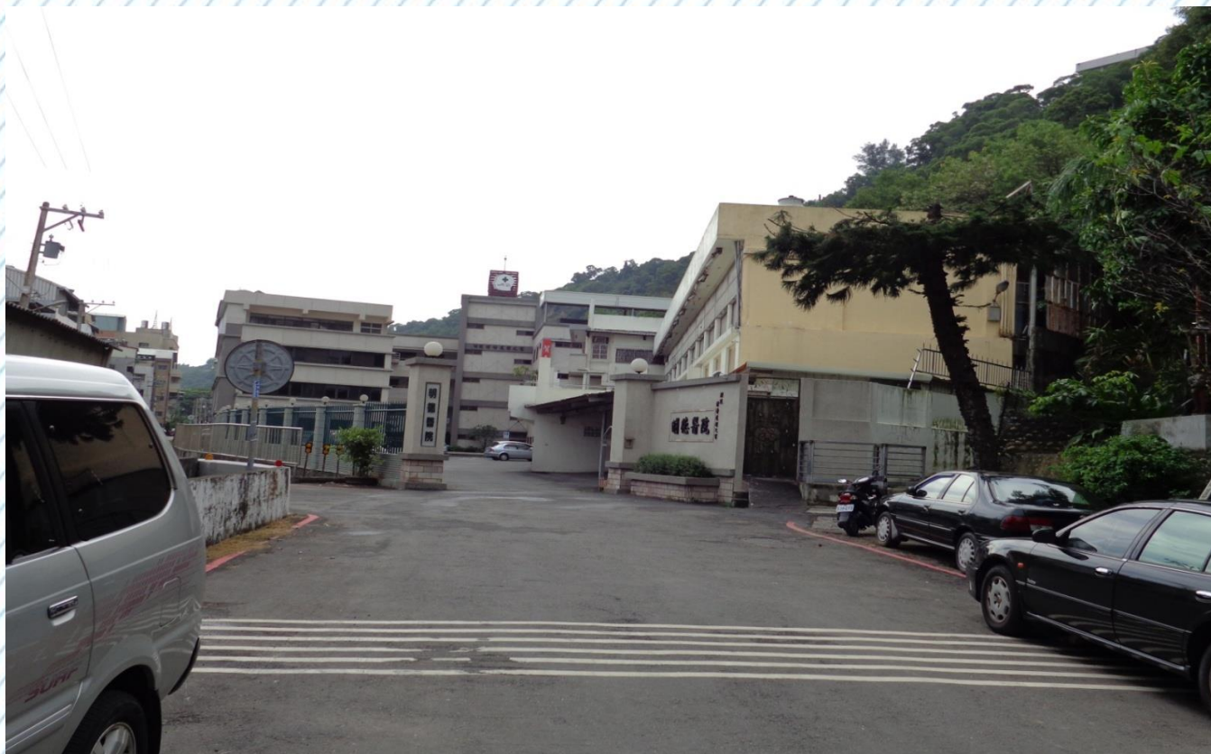
進德校區西側門明德醫院前轉彎處(6-2)