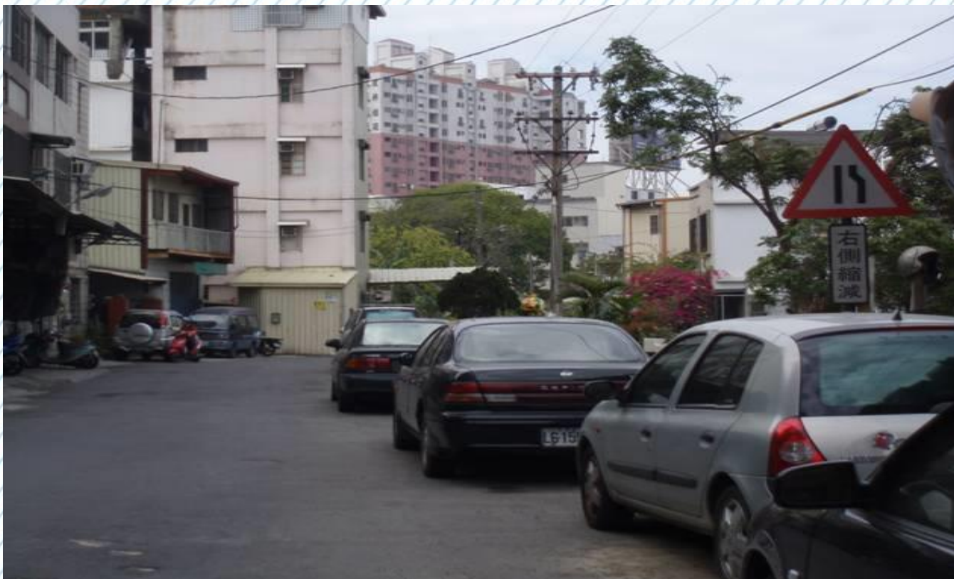
進德校區西側門前往中山路2段翠林園前(7)