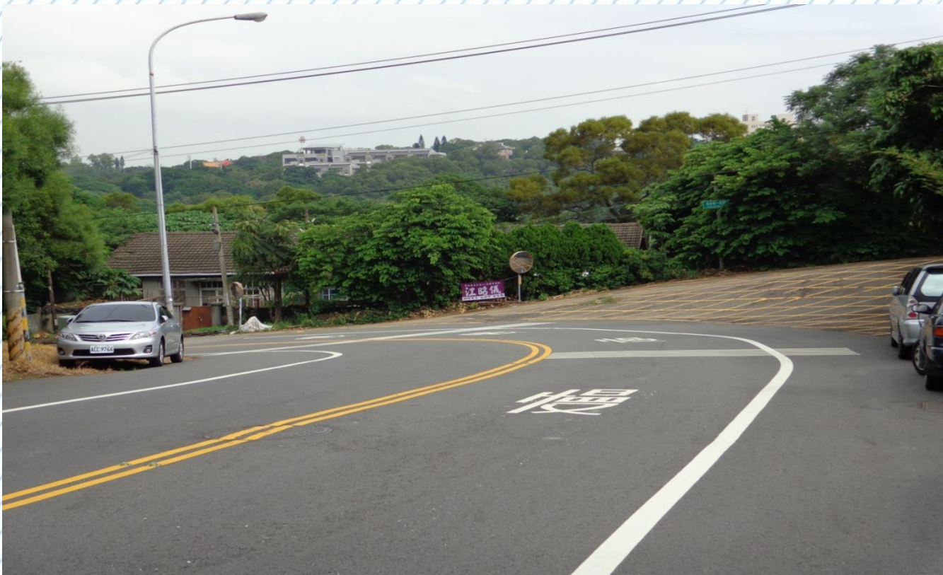
彰化市寶山路接南郭路轉彎處(12)