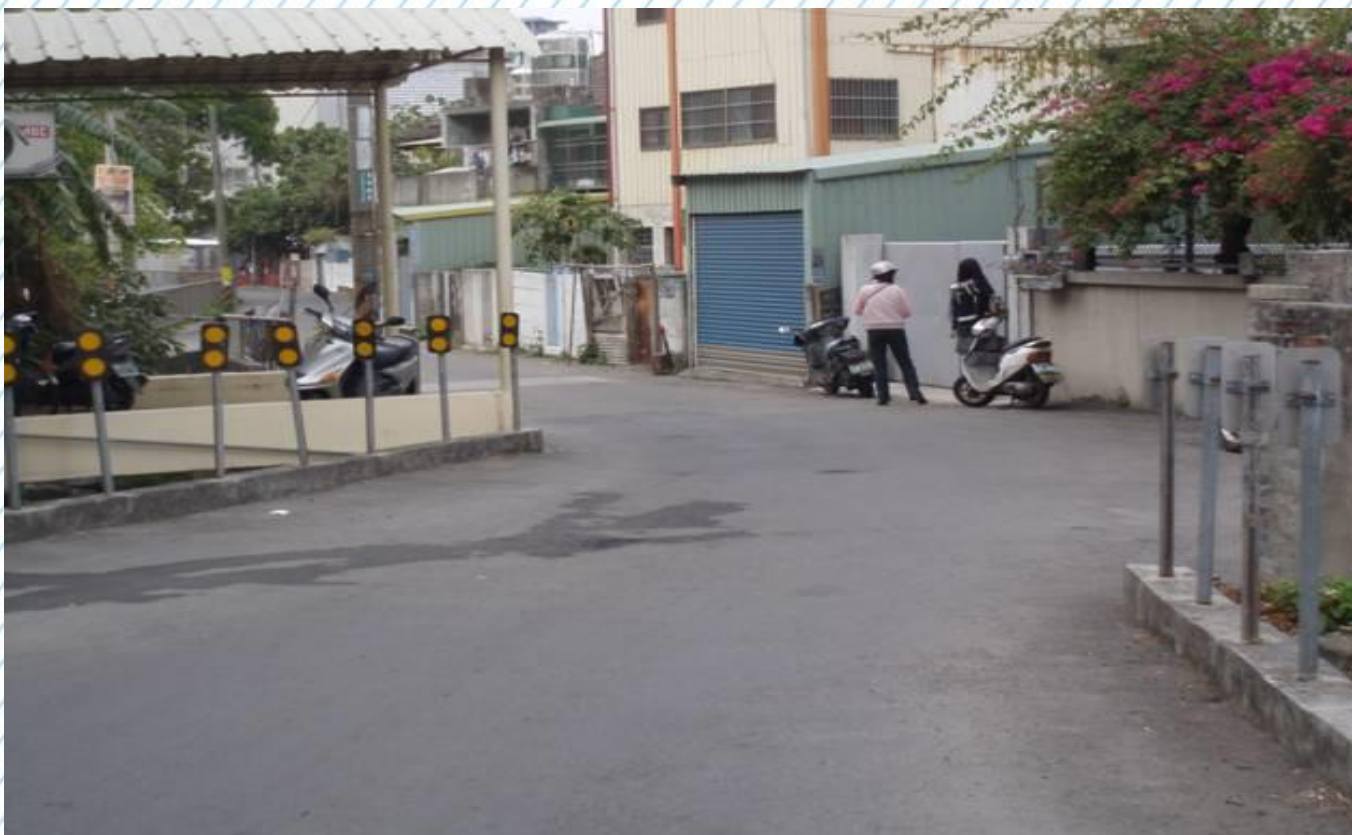
進德校區西側門前往中山路2段轉彎處(8)