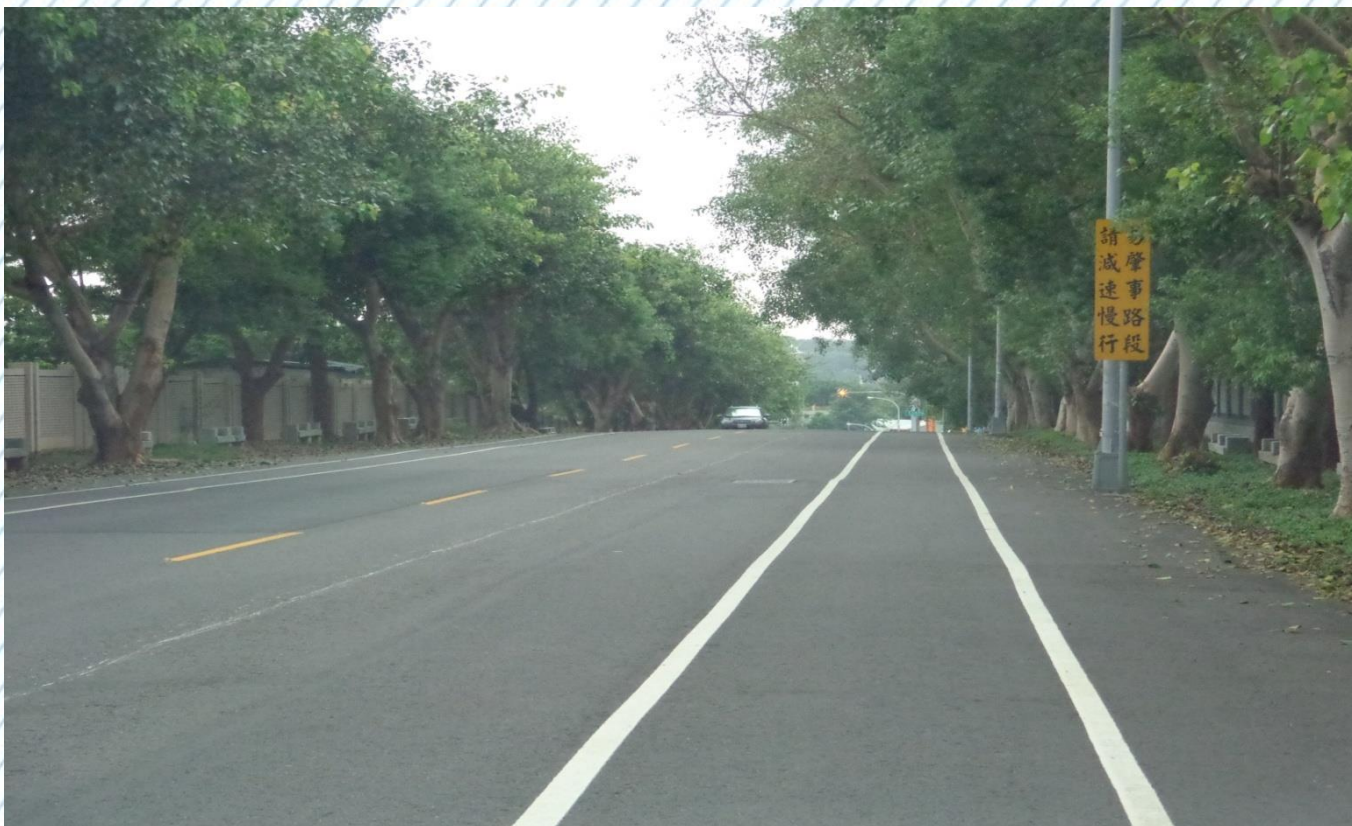
寶山路軍人公墓旁警示標誌(16)