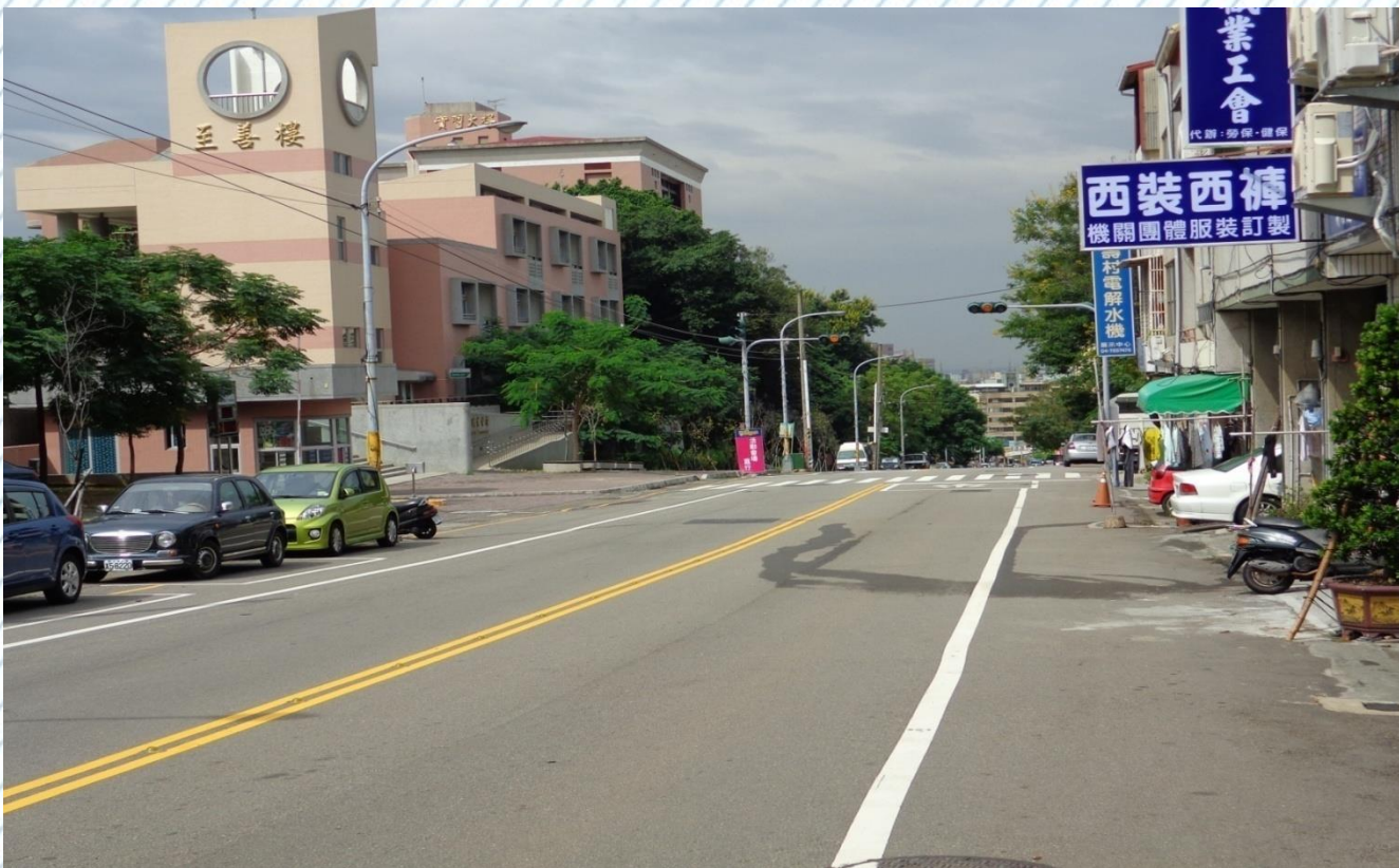
彰化市南郭路彰化高商前 (11)